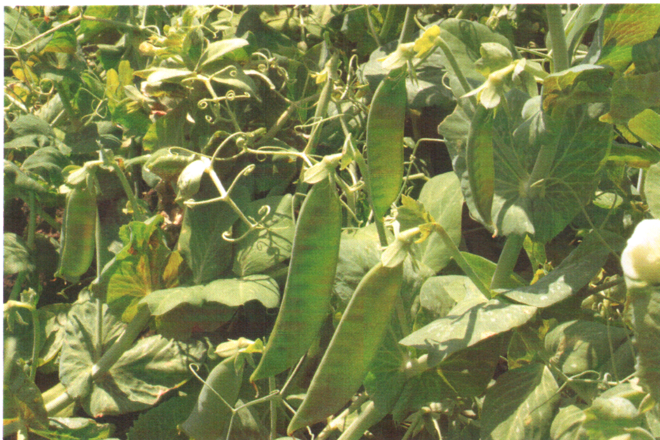
Debreceeni sötétzöld - borsó