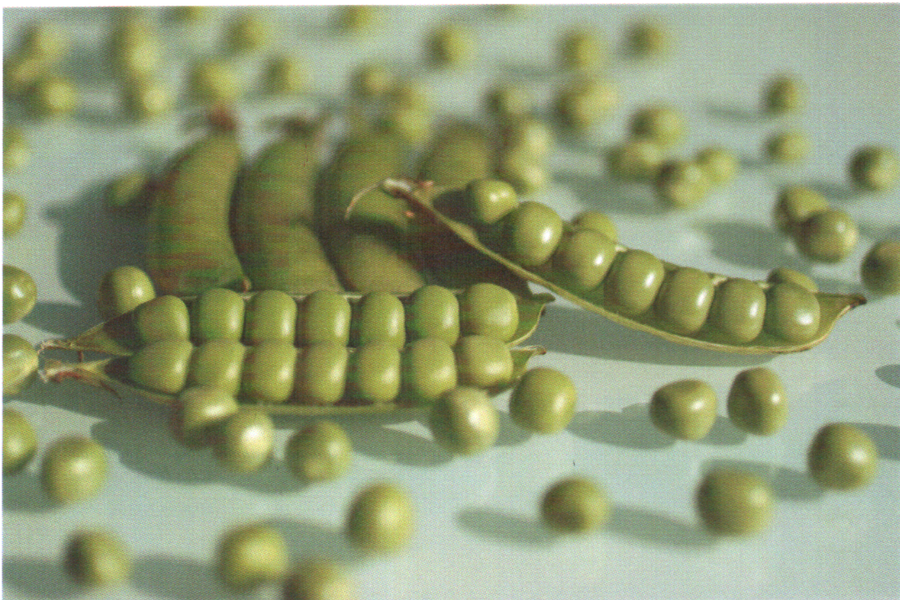
Debreceni világoszöld - borsó