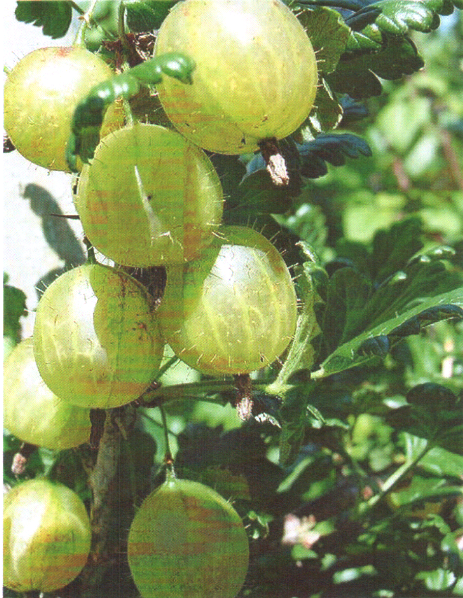
Pallagi óriás köszméte